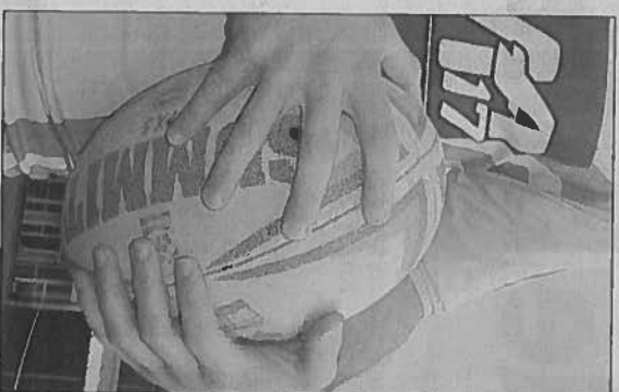
Allez les petits !

Pour les papas et les mamans qui le souhaitent, il est également bon de noter qu'il existe une équipe de