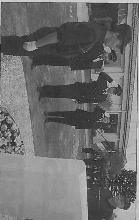
Dépot de gerbes à la mémoire du personnel pénitentiaire.